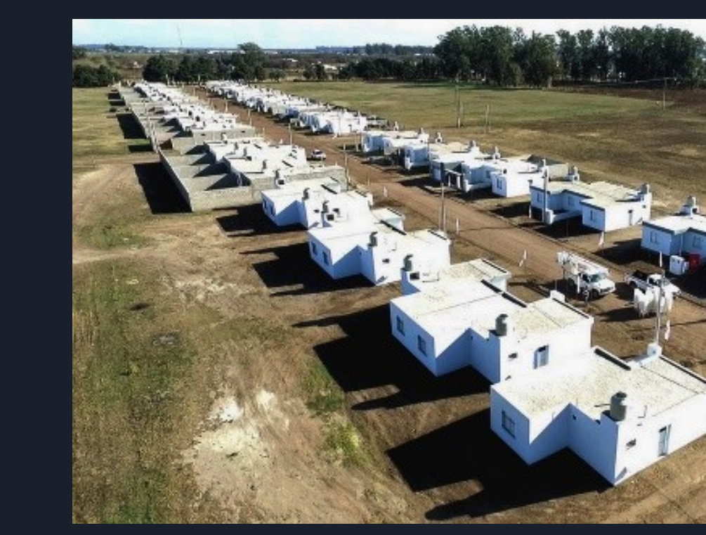
Fig. 3. Imagen del programa habitacional vigente, Plan Casa y Casa Social.